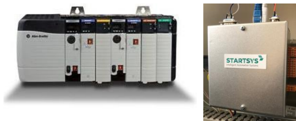
Fig. 3: PLC / Módulo STARTSYS